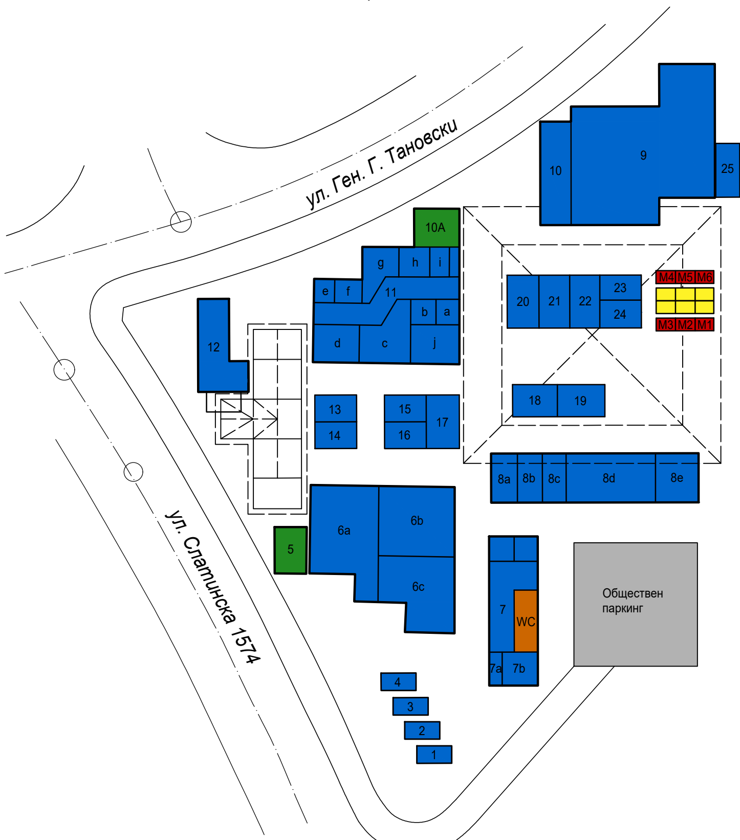
Схема за поставяне на преместваеми обекти за търговски и обслужващи дейности Пазар "СЛАТИНА"